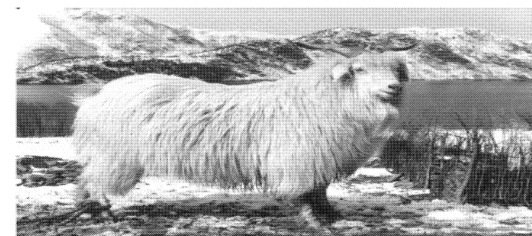
图 A.2 辽宁绒山羊母羊相片