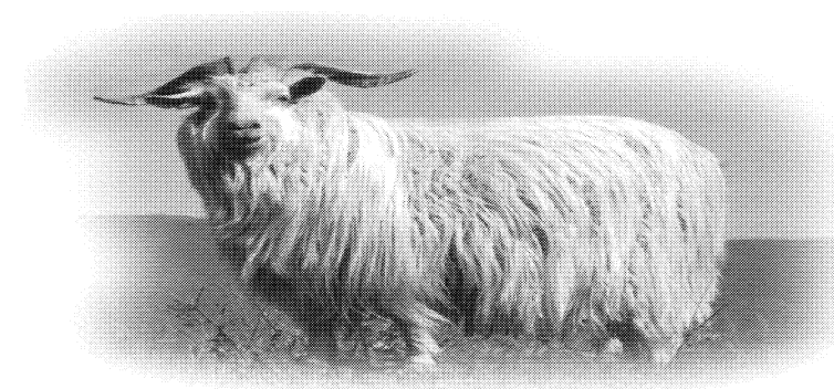
图 A.1 辽宁绒山羊公羊相片